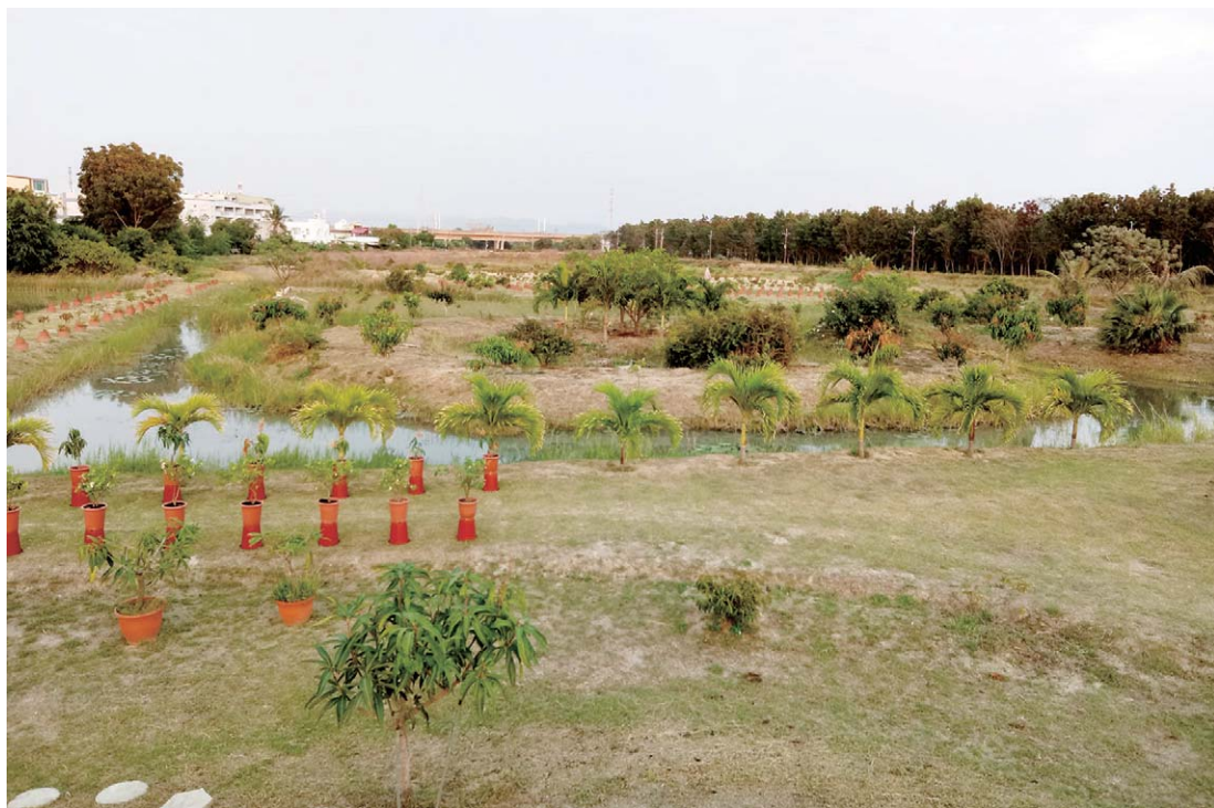
正誠校友擘畫的臺科農園區

「臺科農園區」創立後，除了果樹盆栽的技術研發外，更能結合文創、健康無毒美食，打造成全新的旅遊風貌，體現動感經濟。成立以來，已經有許多學校在此進行戶外教學，學子在這裡學到：現代農業其實是最具現代生產、教育與娛樂的服務業，不僅是群聚產業，更兼具自然保育及人文建設等多元產業鏈。