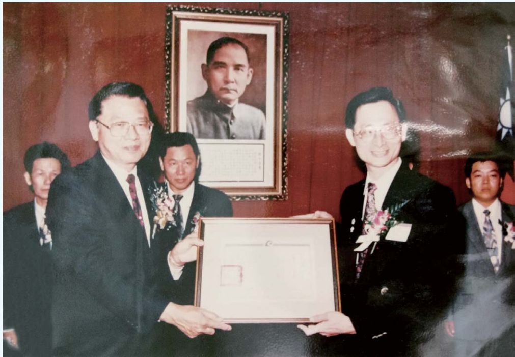
經濟部江部長丙坤頒中小企業第一屆創新研究獎助證書(民國82年)