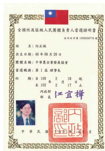
民國一百年當選中華農發會負責人當選證書

今天，從燕巢瓊興路進入園區，可以看到一片池塘，以及一整排的芒果樹和小葉欖仁，整體給人乾淨清爽，確實和一般的農園不太一樣。進入之後，一盆又一盆整齊排列的盆栽，種植各種不一樣大小盆的水果，有芒果、龍眼、荔枝、蓮霧、釋迦、無花果、柑橘、木瓜．．．多樣而豐富，這就是正誠校友推廣全