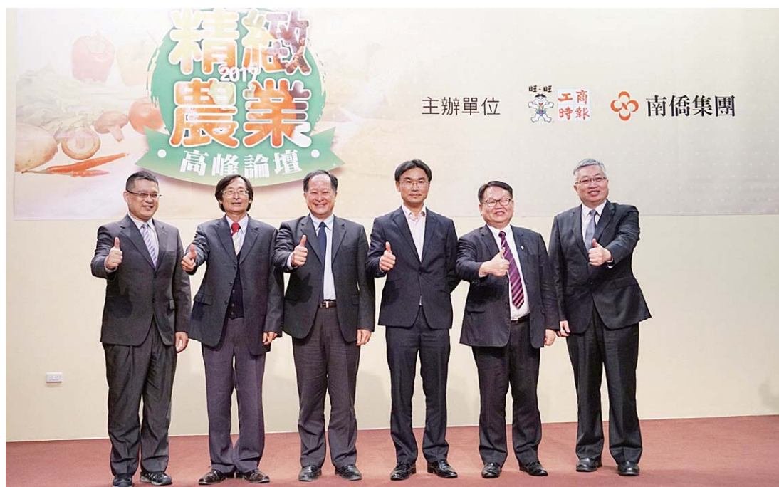
一〇六年精緻農業高峰論壇(左二為正誠校友)