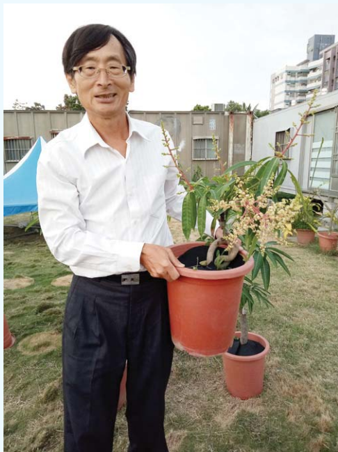
正誠校友與他的果樹盆栽景

「果樹盆栽景」這個概念和發明的理念是一致的，就是以創意農業改變傳統農業，讓農業精緻化，運用高新技術領航科農，關鍵在於「創造不可取