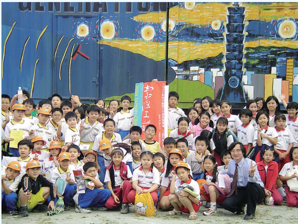
九十三年花蓮城坦創意文化產業博覽會，工藝彩繪列車