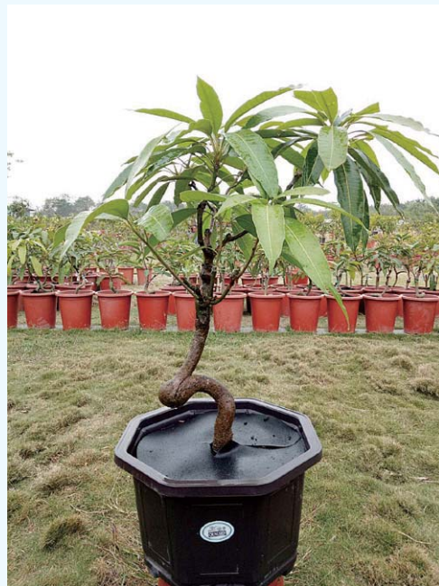
正誠校友與他的果樹盆栽景，會轉彎的果樹