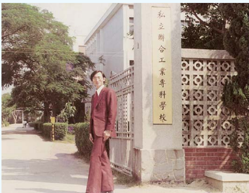
攝於聯合工專校門口

服務聯合工專期間，除任教本職外，正誠校友特別照顧貧困家庭學子，主動發起協助學校成立「學生生活輔導諮商室」，請來多位熱心、自發性、無給職的教師共同主持，協助更多貧困學子得以安心向學。此後一直延續服務母校初衷，並擔任兩屆「校友會理事長」，訂定《傑出校友選拔辦法》，服務更多校友。