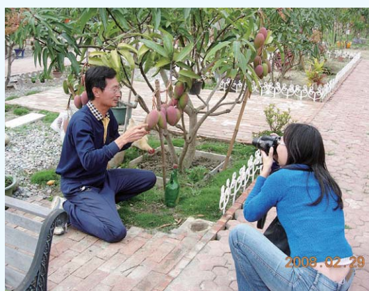
正誠校友接受記者採訪創意農業(攝於民國97年)