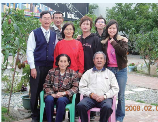
全家福合影(最左立者為正誠校友，攝於民國97年)

正誠校友認為，以前的農人在生活上經常被冠以「貧、苦、髒」的刻板印象，年輕人遠離農村，女性也不願嫁作農婦。因此，為了扭轉傳統印象，替農村注入新活力，正誠校友思考利用科技農業打造「有機農業、康養農