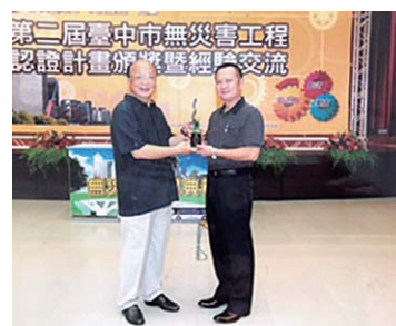
第二屆臺中市無災害工程加權 累計工期B組第一名