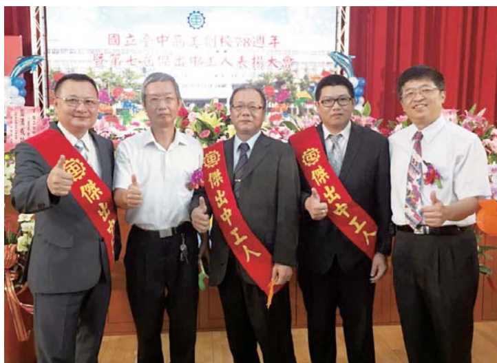
第七屆臺中高工傑出中工人頒獎