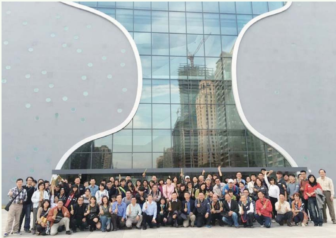
2016.1.9舉辦建築系友會參訪臺中歌劇院