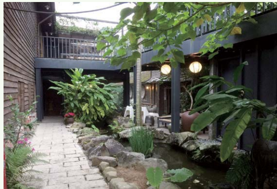
水里蛇窯陶藝文化園區