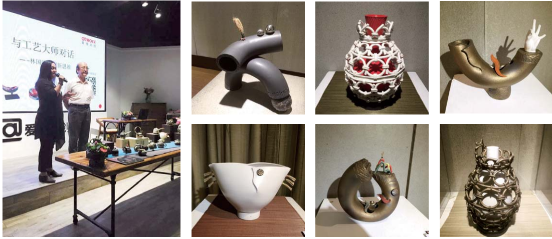
陶藝作品，國隆校友提供

色，都是陳老師與學生的精彩大作，其中國隆校友兩件作品「虛實山水」與「虛實構造」參與，整個展覽十分精彩、成功。